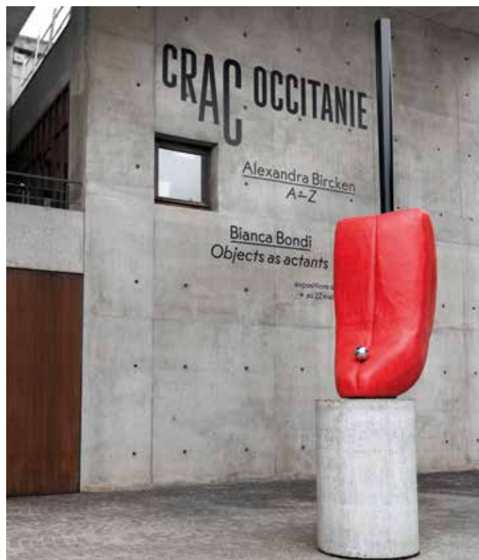
Slip of the Tongue [Lapsus], 2020 Aluminium, acier inoxydable, acier, béton, laque, 600 x 100 x 200 cm Collection famille Becker

L'exposition A-Z d'Alexandra Bircken est conçue en collaboration avec le Museum Brandhorst à Munich où l'exposition a été présentée du 28 juillet 2021 au 16 janvier 2022 (commissaire Monika Bayer-Wermuth).