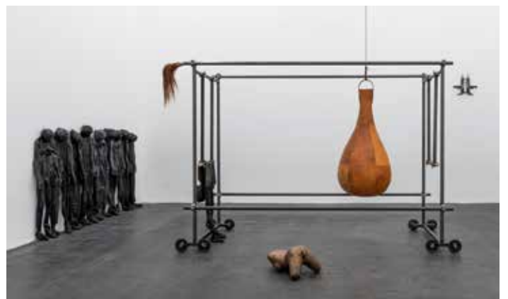
Vue de l'exposition, salle 7 (A gauche) Deflated Figures [Figures dégonflées], 2021 Latex, rembourrage, tissu en coton, cintre, échelles