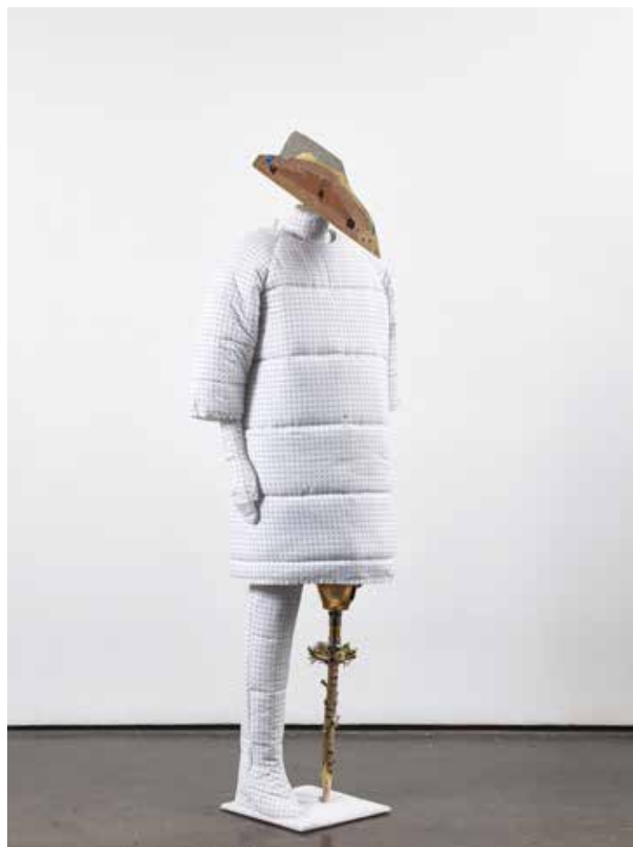
The Doctor , 2020 Mannequin, tissu, ouate, fil, métal, prothèse de jambe, tronc d'arbre, maquette de bateau, support en métal, 183 x 62 x 60 cm The Hunterian, University of Glasgow

Le corps chez Alexandra Bircken se manifeste également par son absence ou une présence en creux : c'est le cas de Madonna (ohne Kind) [Madonne (sans Enfant)], dont le corps n'est matérialisé que par un contour ou avec Nabelschau [Vue du nombril], silhouette féminine enceinte réalisée au crochet, qui fait figure de costume à revêtir ou de mue abandonnée.