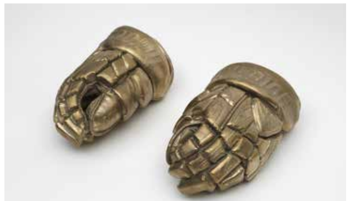
Warrior , 2020 Bronze, 13,5 x 16 x 28,5 cm Collection Udo et Anette Brandhorst