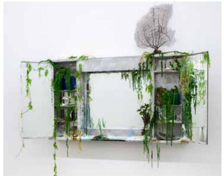
Insatiable trésor, temple simple à Aphrodite , 2022

Aphrodite : est la déesse de la fécondité dans la mythologie grecque. Son action s'étendait à toute la nature, aux plantes et aux animaux aussi bien qu'aux humains.