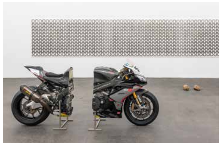
Uknit Bonn, 2012* Acier, bois, clous, peinture mate, 150 x 900 cm Courtesy de l'artiste, BQ, Berlin et Herald St, Londres RSV 4, 2020 Moto, acier, 2 parties : avant : 117 x 112 x 77 cm, arrière : 100 x 103 x 57 cm Courtesy de l'artiste, BQ, Berlin et Herald St, Londres Warrior [Guerrier], 2020 Bronze, 13,5 x 16 x 28,5 cm, Collection Udo et Anette Brandhorst

« Les moulages de vagins montrent non seulement l'extérieur visible du corps féminin, mais aussi sa prolongation à l'intérieur. L'intérieur devient visible et physique. Je voulais aussi montrer ce qui ne se voit pas de l'extérieur. La sexualité féminine est plus invisible et cachée que celle des hommes. Je crée en tant que femme avec ce que je connais et montre comment c'est. » Alexandra Bircken