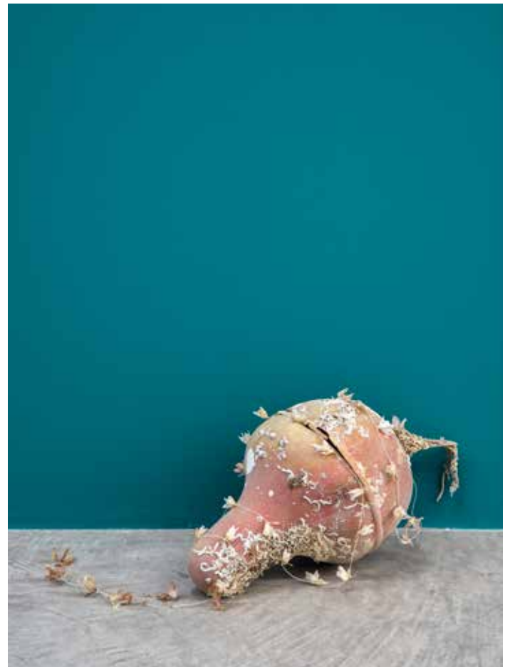
Quand sur l'abîme un soleil se repose, 2022

Les murs de l'entrée et de la première salle de l'exposition sont peints en bleu océan. Cette couleur plonge le spectateur dans une installation immersive. Dans les sculptures, les jeux de lumière, le reflet des miroirs, le scintillement du sel, la couleur des feuillages, des fleurs et des pierres, le bleuté du vert-de-gris témoignent de l'obsession de Bianca Bondi pour la couleur. Le sel, quant à lui, change les couleurs des objets et crée un relief de cristaux comme de la dentelle.