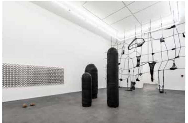
Big [Grand], Ugly [Laid], Fat [Gros], Fellow [Type], 2014 Laine, bois, mousse, plastique, tissu, latex, métal, respectivement : 278 x 56 (diam.) cm, 161 x 50 (diam.) cm, 235 x 91,5 (diam.) cm, 235 x 91 (diam.) cm Collection privée, Cologne, sauf Fellow : Museum Ludwig, Cologne

Dans le texte en prose Le dépeupleur (1970), Samuel Beckett met en scène 200 "chercheurs" nus confinés dans un cylindre, dans lequel la lumière et la température varient fortement, entraînant cécité, problèmes de peau et un climat hostile au sexe. Les murs et le sol sont en caoutchouc. Certains tentent d'accéder par des échelles à des niches, d'autres vaincus restent au sol.