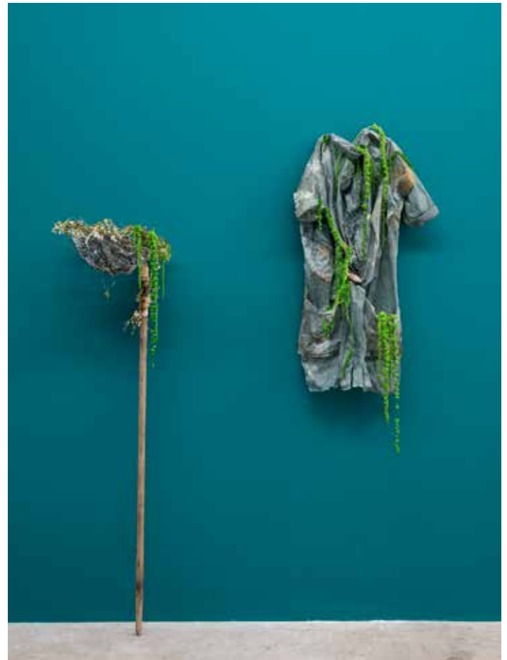
Nyx , 2022

B.B. Propos recueillis par Léa Cotart-Blanco © 2018 Point contemporain à l'occasion de l'exposition de Bianca Bondi, Diet & Psychology aux Limbes, Saint-Etienne, du 07 au 29 septembre 2018.