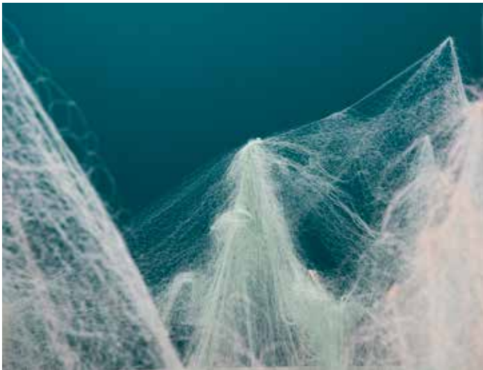
Entre le vide et l'évènement pur / coupe d'haleine, cheveux d'ange (Détail), 2022 Filets de pêche abandonnés Production Crac Occitanie et Cité scolaire Paul Valéry à Sète

Nyx est, dans la mythologie grecque, la divinité de la Nuit et la mère primordiale de tous les principes cosmiques. En tant que matrice universelle, la Nuit est liée à l'élément aquatique et souterrain, lieu de gestation des semences. La nuit représente la dimension du rêve et de l'éros ainsi que l'entrée dans le domaine du fantastique et de l'occulte. Dans l'art antique elle est figurée sous les traits d'une femme enveloppée d'un voile noir et couronnée de fleurs de pavot. Le cimetière marin : poème de Paul Valéry commencé en 1917, pendant la guerre, et paru en 1920. Le poème passe de la contemplation de la mer sous le soleil de midi, depuis le cimetière qui domine la ville de Sète, ville natale du poète, à une méditation sur la mort.