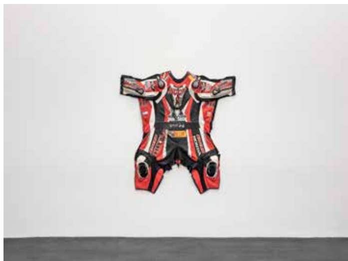
Snoopy , 2014 Combinaison de moto, 153 x 161 x 14 cm Collection Udo et Anette Brandhorst

Un médecin de peste ou docteur de peste, était un médecin spécialisé dans la prise en charge de la peste bubonique. Au XVII e siècle et XVIII e siècle, ils portent un masque en forme de long bec blanc recourbé (leur valant la comparaison avec des vautours) rempli d'herbes aromatiques conçues pour les protéger de l'air putride selon la théorie des miasmes de l'époque.