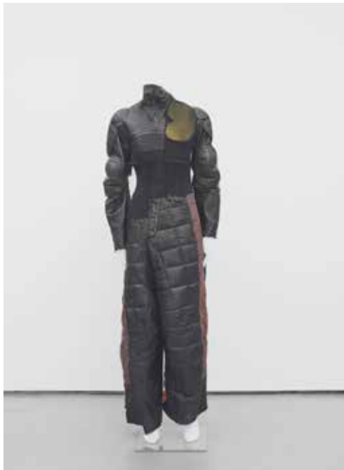
INXS , 2016 Mannequin, équipement de moto, métal, boutons, cuir, denim, latex, collants en nylon, ouate, coussinets de protection, cheveux, support en métal, 165,5 x 53 x 26,5 cm Collection Danniell Rangel, Paris

La notion de « vêtement architectural » présente dans l'exposition est associée à un rôle de protection. Cagey [Méfiant] est une microarchitecture en forme d'abri faite de tissus tressés avec des branches, des cordes et du mortier. Déployées sur 9 mètres de long, les mailles d'acier de la sculpture murale Uknit Bonn [« You knit » / Tu tricotes Bonn] évoquent la côte de maille des chevaliers.