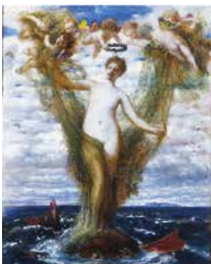
Arnold Böcklin, Vénus sortie des eaux , 1872, huile sur toile, 59,1 x 45,7 cm, Musée d'art de Saint-Louis

Dans l'installation Entre le vide et l'évènement / coupe d'haleine, cheveux d'ange , les filets ressemblent à une immense chevelure aérienne installée au centre de la salle. Cette œuvre s'inspire du tableau de la Vénus sortie des eaux (1872) d'Arnold Böcklin.