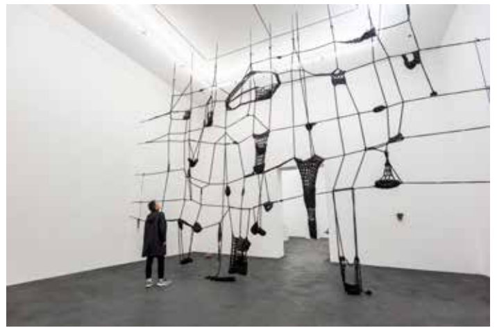
Sans Titre , 2011 Polypropylène, 700 x 800 x 50 cm

Alexandra Bircken l'associe à des éléments naturels comme des branches, des troncs d'arbre, des brindilles, dans la tradition de l'arte povera. Birch Field [Champ de Bouleaux], sculpture murale faite de branches de bouleaux, maintenues entre elles par un tricot, lui-même plongé dans le mortier, réconcilie la conception moderniste de la grille et la nature.