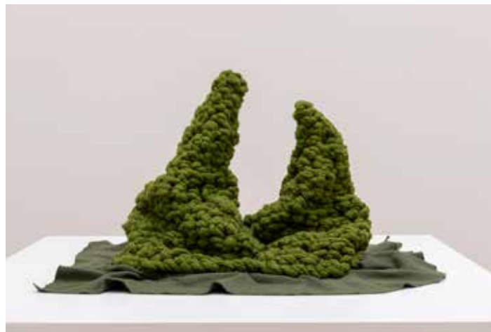
Berge , 2003 Laine, coton, 29,5 x 55 x 54 cm, Collection privée

La bouteille de Klein : En mathématiques, la bouteille de Klein (prononcé kla.in) est une surface fermée, sans bord et non orientable, c'est-à-dire une surface pour laquelle il n'est pas possible de définir un « intérieur » et un « extérieur ». La bouteille de Klein a été décrite pour la première fois en 1882 par le mathématicien allemand Felix Klein.