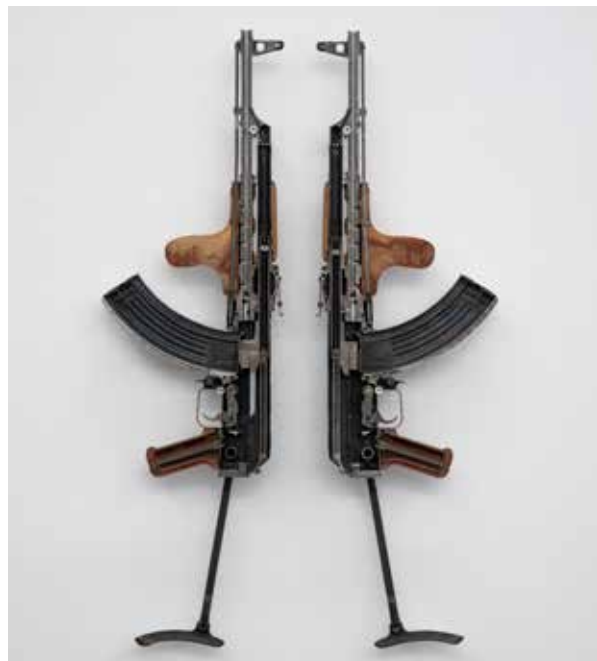
AKS 47, 2020 Fusil d'assaut en deux parties, l'ensemble 87 x 55 x 5 cm Collection privée, Cologne

C'est à une véritable autopsie du réel que l'artiste nous invite au fil de l'exposition, lorsqu'elle ouvre les objets ou qu'elle rend visible l'invisible. Ses œuvres évoquent ce qui depuis longtemps l'habite : la mise au jour du fonctionnement d'un objet, son intimité, la manière dont il est construit ou assemblé, qu'il s'agisse d'un vêtement, d'une moto ou d'une