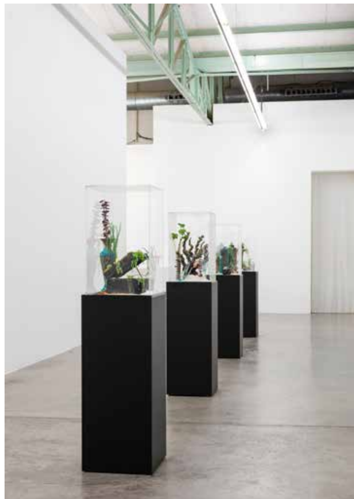
Vue de l'exposition Objects as actants