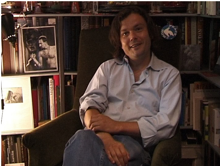
Portrait de Jean-Michel Othoniel. Capture du film Le paysage amoureux d'Othoniel .