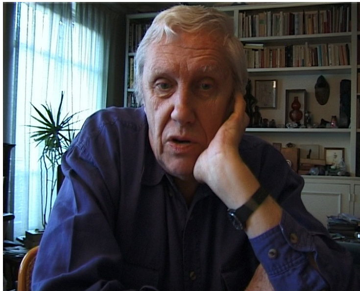
Portrait de Paul-Armand Gette. Capture du film La liberté du modèle .