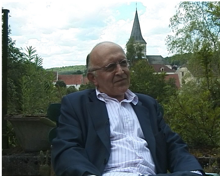
Portrait de Bertrand Lavier. Capture du film Bertrand Lavier Versailles Chantiers .